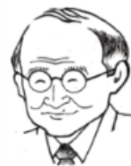
児童精神科医 佐々木 正美先生